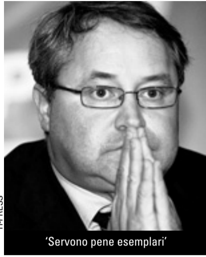
'Servono pene esemplari'

La stessa coerenza che, secondo il presidente cantonale, dimostra il Ppd anche in altri campi come ad esempio la politica finanziaria. Il gruppo parlamentare popolare democratico ha deciso di respingere l'iniziativa fiscale della Lega perché «la situazione finanziaria dello Stato è precaria con un disavanzo medio annuo di circa 150 milioni di franchi». Accettare l'iniziativa - che causerebbe una minor entrata di 130 milioni - significa «affon-