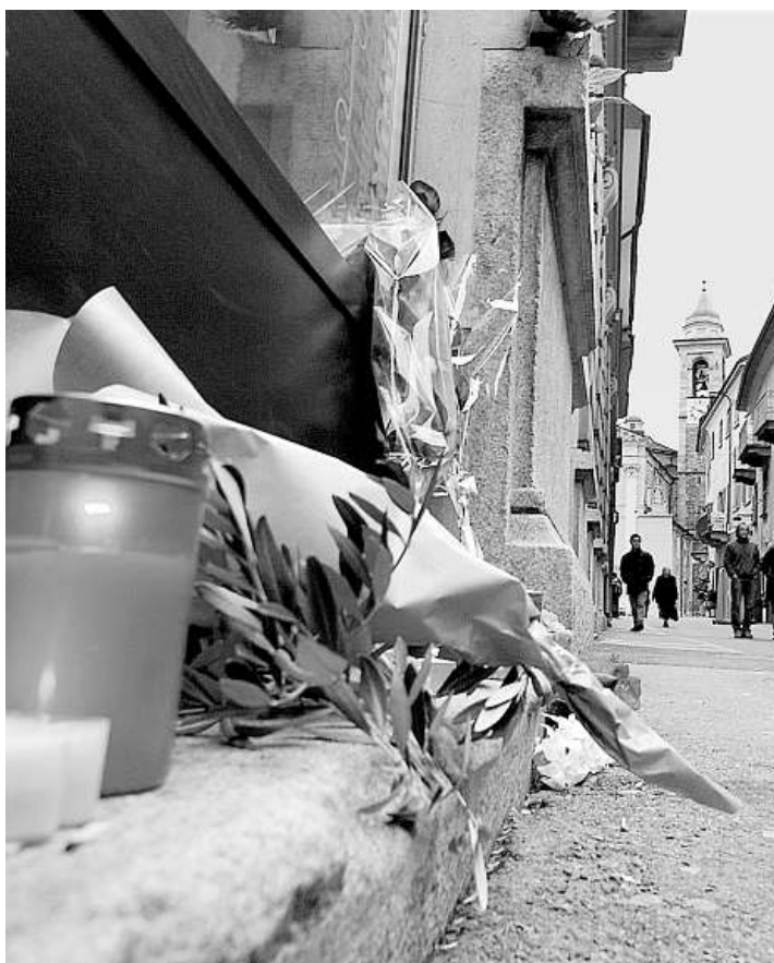
SOLIDARIETÀ In alto una delle marce di solidarietà che avevano radunato centinaia di persone sconvolte dal feroce pestaggio mortale. Qui sopra il luogo dell'uccisione per mesi meta di un pellegrinaggio.